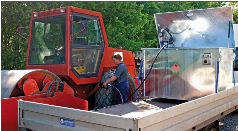
Typ MT 1000 mit Elektropumpe (Zubehör)

Mobile Betankung von Fahrzeugen, Baumaschinen, Geräten und Aggregaten mit Diesel oder Heizöl. Internationale Beförderung gefährlicher flüssiger Güter nach ADR/RID/IMDG-Code, Verpackungsgruppen II und III