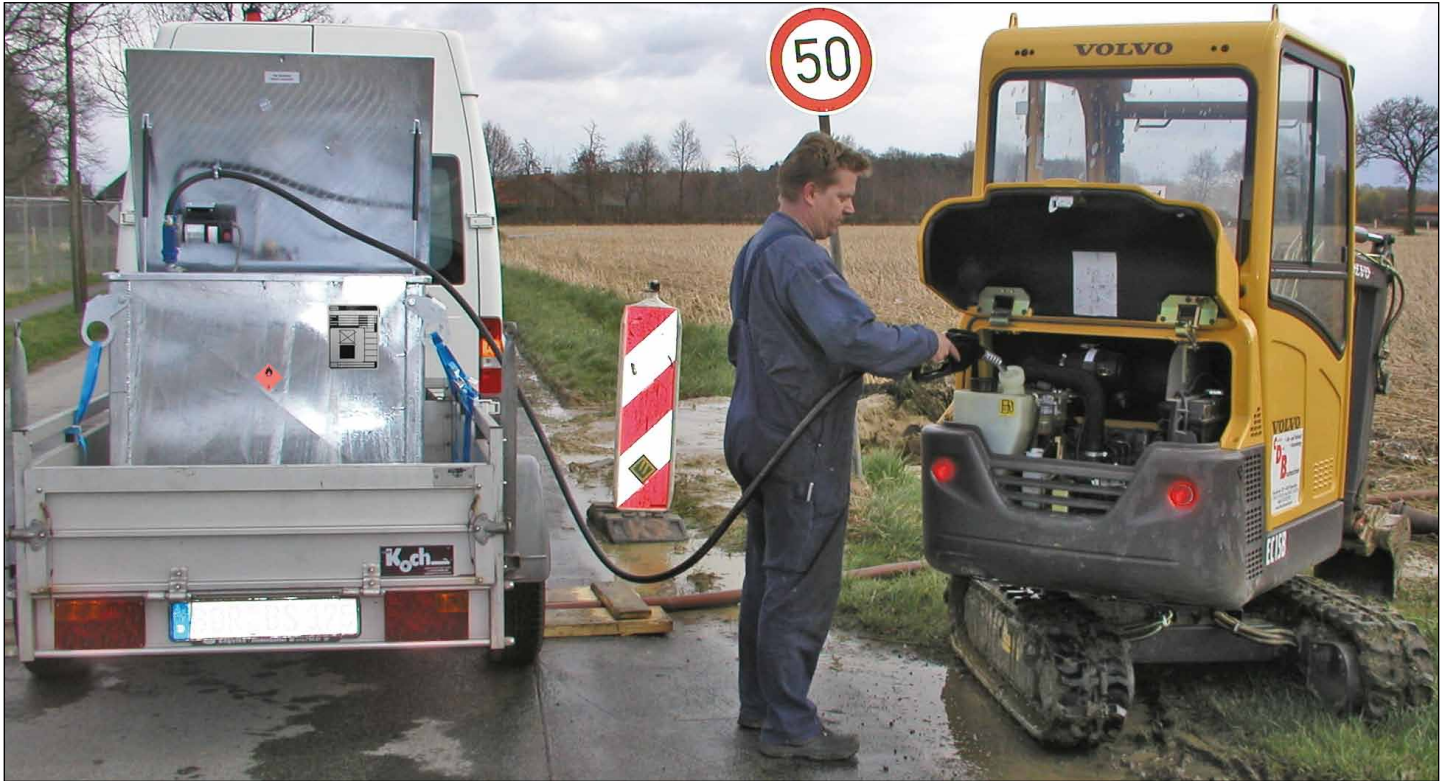
Typ MT 450 mit Elektropumpe (Zubehör)