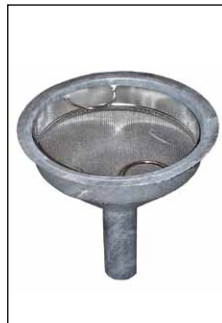
Trichter mit Edelstahl-Sieb (Zubehör)