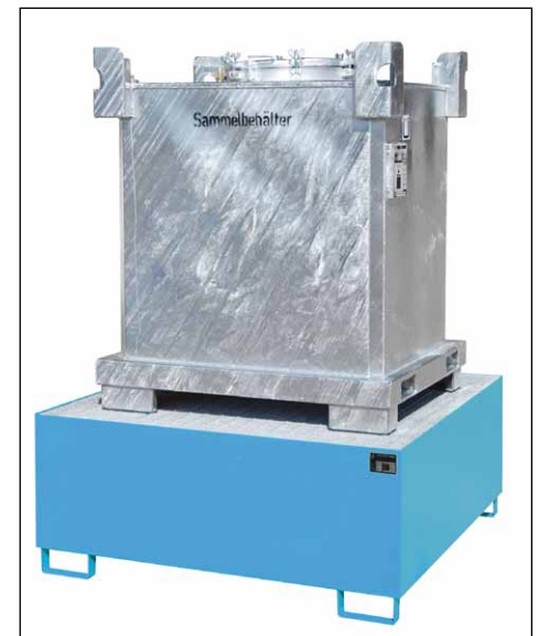
Typ SAF mit Auffangwanne (siehe Seite 85)