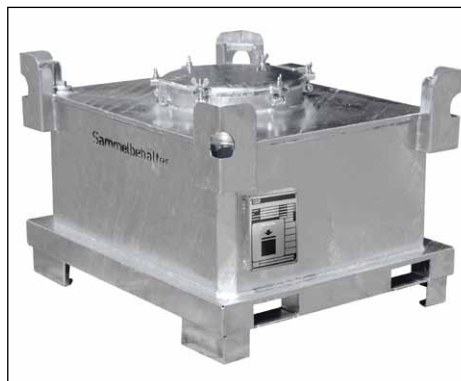
Typ SAF 450