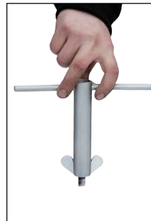
Schlüssel für Flügelmuttern (Zubehör)