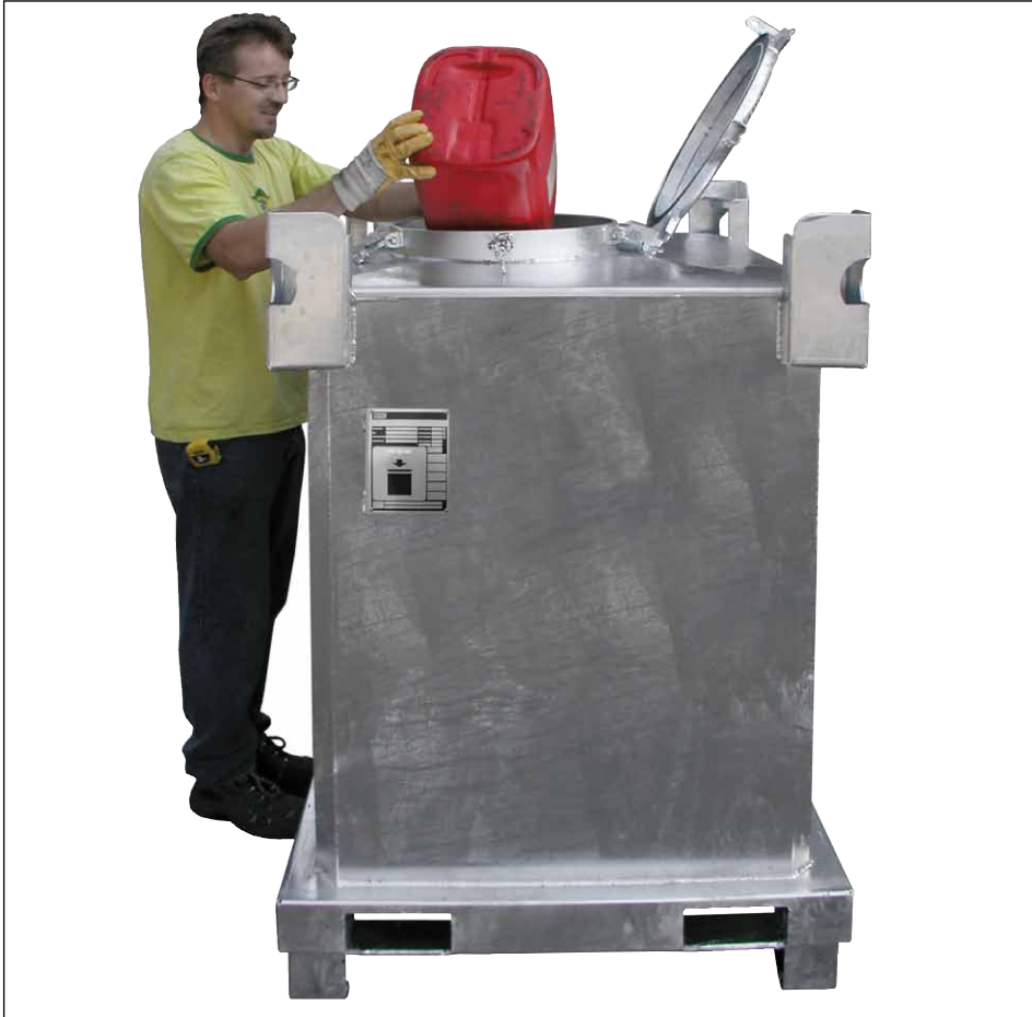
Typ SAF 1000

Internationale Beförderung gefährlicher flüssiger Güter nach ADR/RID/IMDG-Code, Verpackungsgruppen II und III