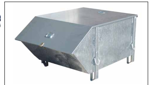
Typ BBG mit Deckel (Zubehör)