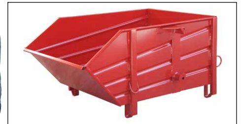
Typ BBP mit Aufnahmezapfen (Zubehör)