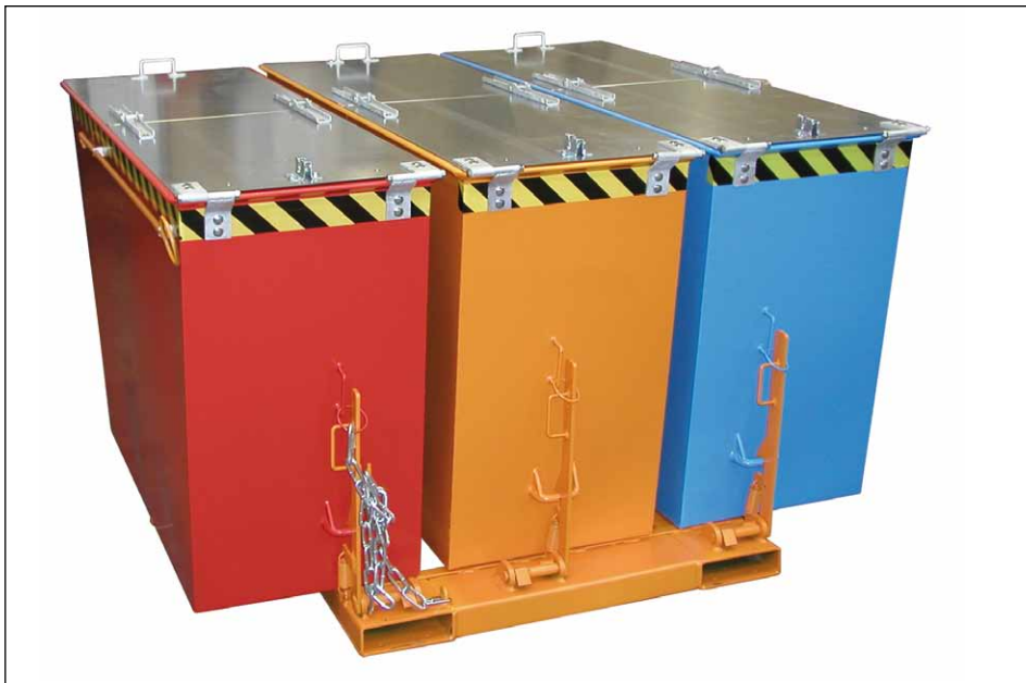
Typ TRIO mit Deckel (Zubehör)