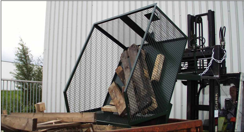
Typ GU-G 1000

Gitterbehälter für leichte Güter, wie z.B. Papier, Kunststoffe, Holz, Grünabfälle