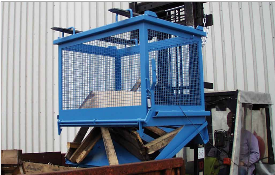
Typ SB-G 1000