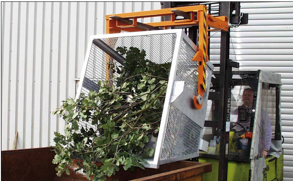
Typ BSK-G 90 mit Typ BST 90