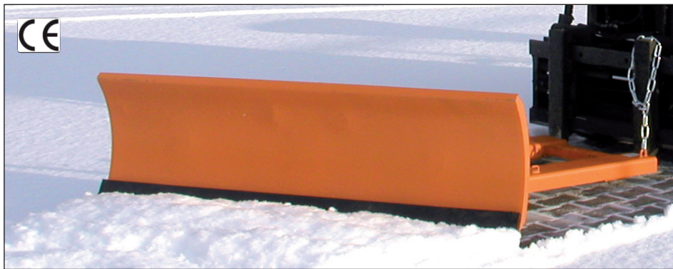
Typ SCH-G mit Gummischürfleiste