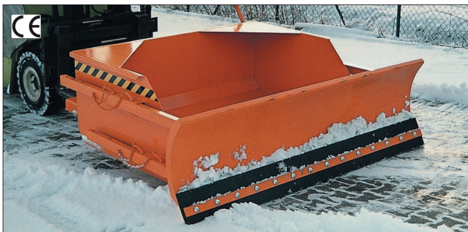
Typ SRS-G mit Gummischürfleiste