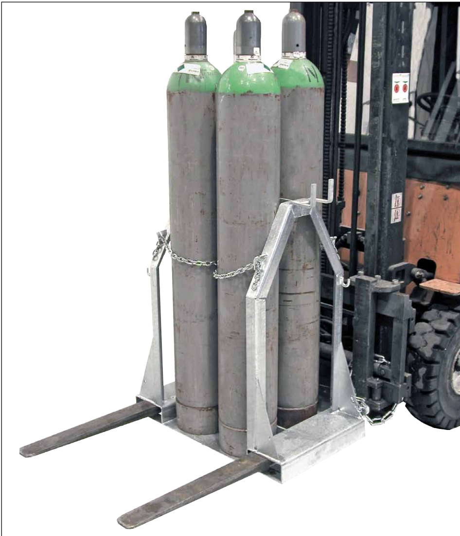
Typ SFP 4

Für den sicheren, wirtschaftlichen und kraftschonenden Transport von 1 bis 8 Stahlflaschen