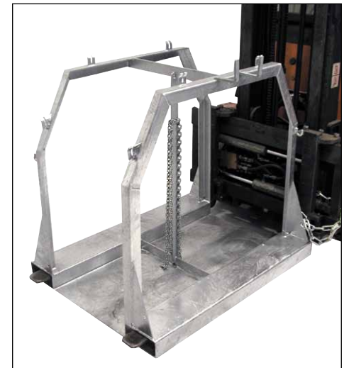
Typ SFP 8