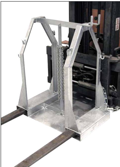
Typ SFP 4