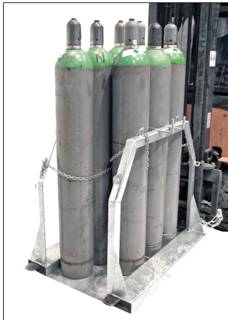
Typ SFP 8