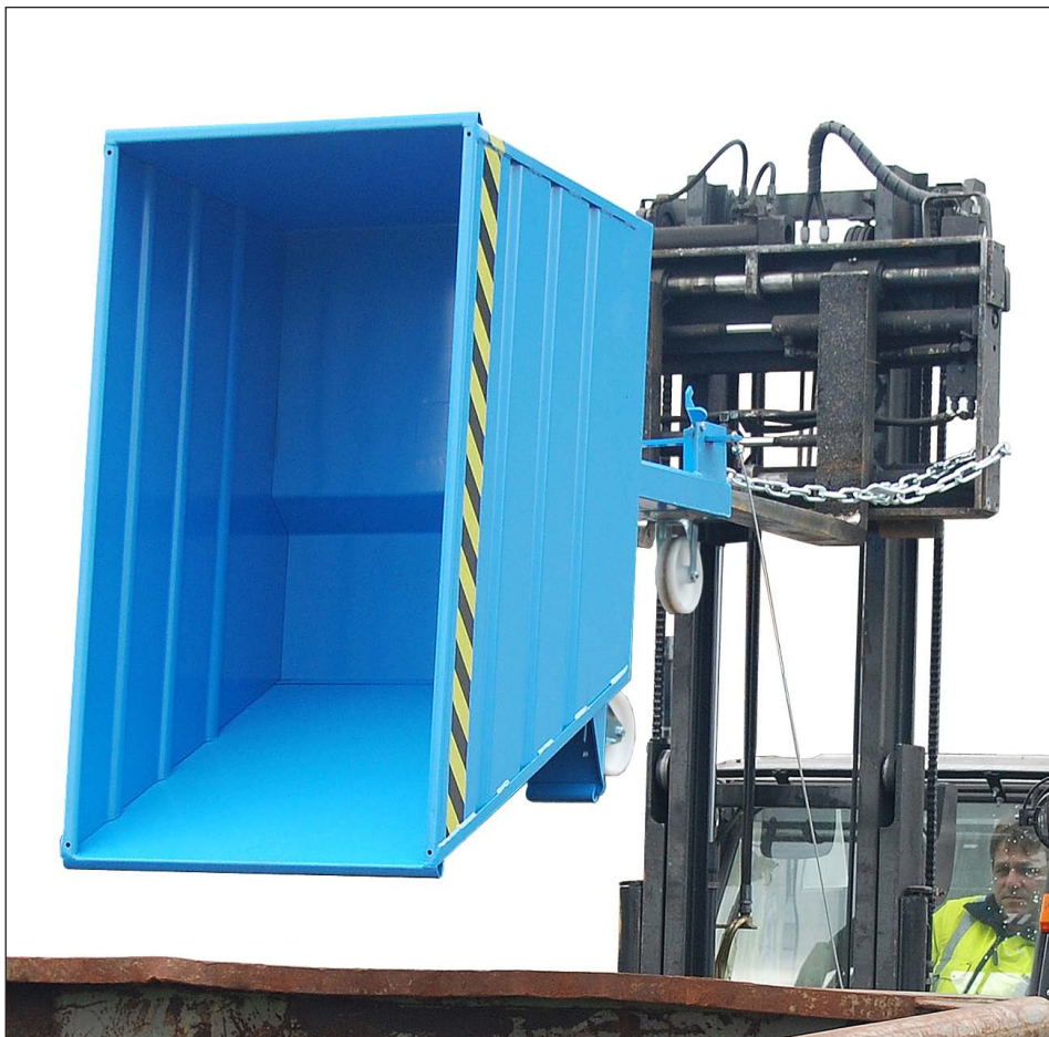
Type VG met wielen