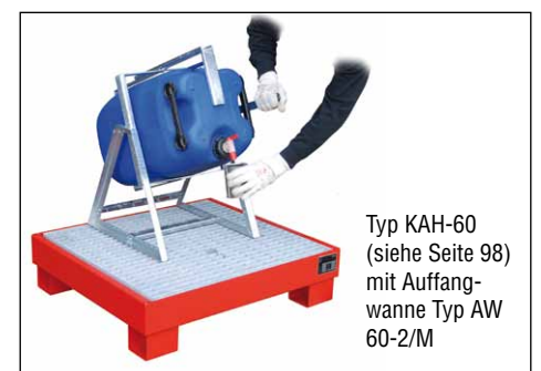
Typ KAH-60 (siehe Seite 98) mit Auffangwanne Typ AW 60-2/M