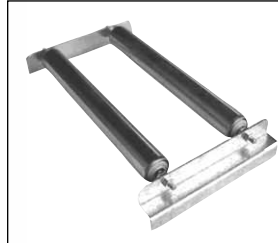
Typ RA 60