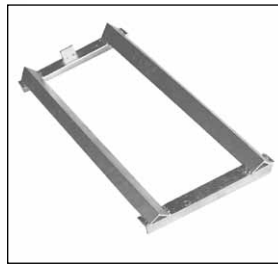
Typ FA 60