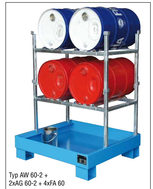
Typ AW 60-2 + 2xAG 60-2 + 4xFA 60