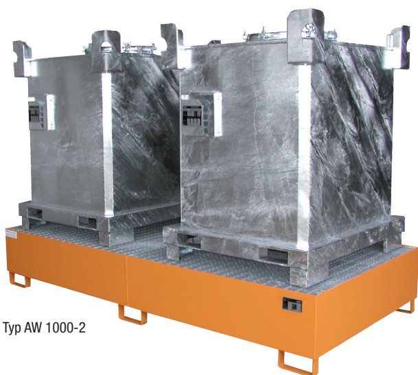
Typ AW 1000-2