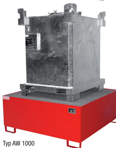
Typ AW 1000