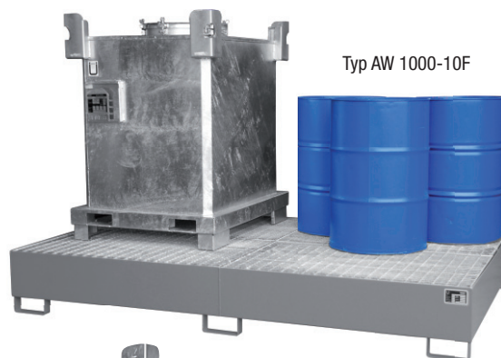
Typ AW 1000-10F