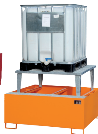
Typ AWA 1000