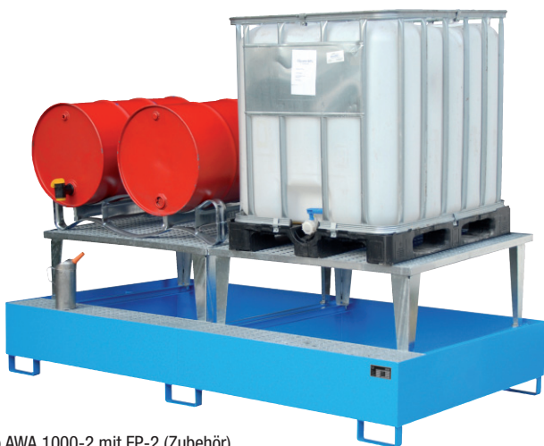
Typ AWA 1000-2 mit FP-2 (Zubehör)