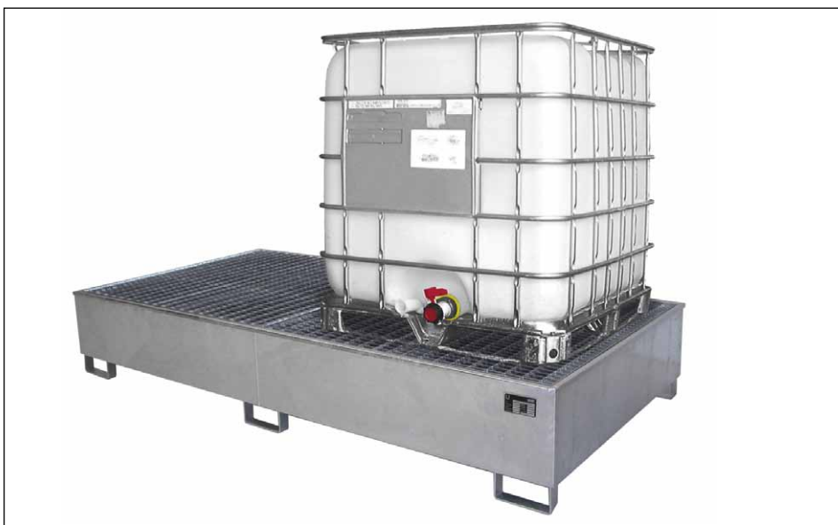
Typ AW 1000-2/PE