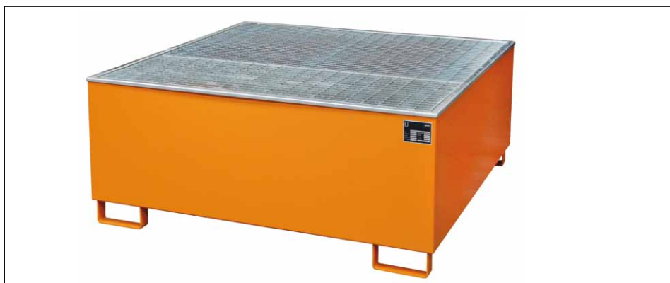
Typ AW 1000/PE