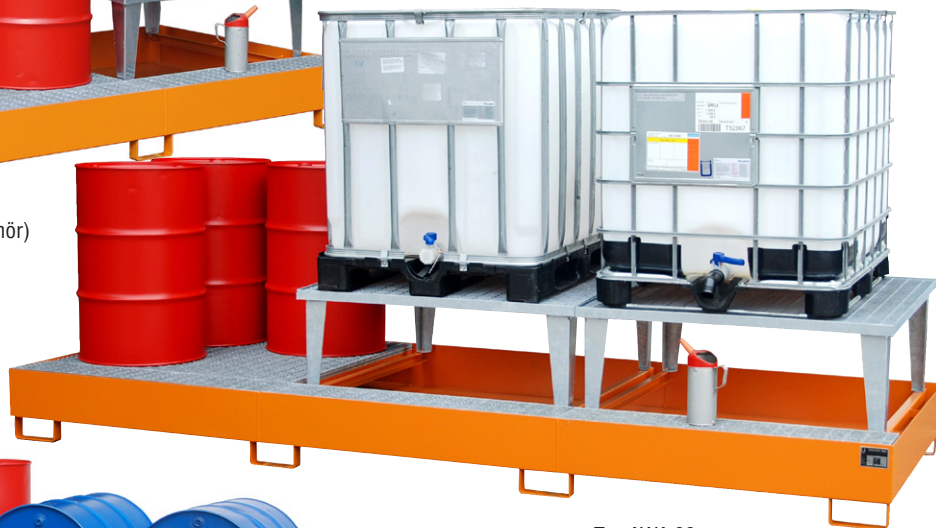
Typ AWA 32