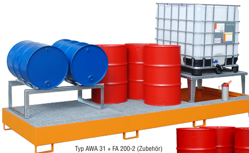
Typ AWA 31 + FA 200-2 (Zubehör)