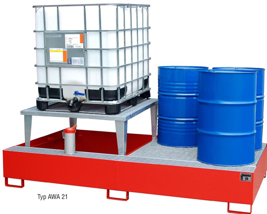
Typ AWA 21