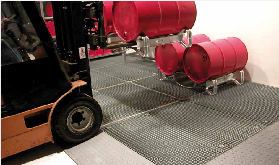
8 x BSW + 5 x AR + 1 x AE + 3 x KV + 10 x WV (Zubehör: Fasspaletten Typ FP-2, Fassregale Typ FR)