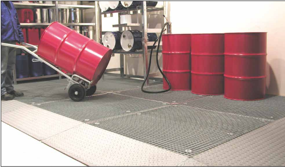
8 x BSW + 5 x AR + 1 x AE + 3 x KV + 10 x WV (Zubehör: Fasskarre Typ FP-V, Fassregale Typ FR)