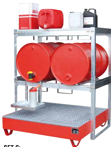
SET C: Typ 2032 + FRE-2/M + GS + FRE-G2/M