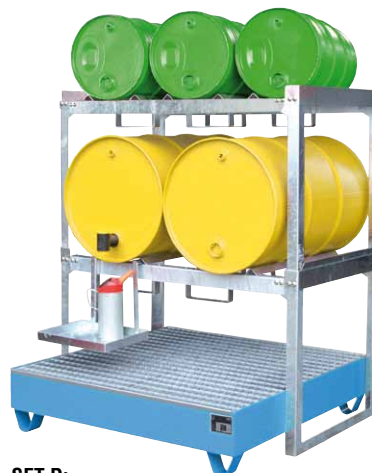
SET D: Typ 2032 + FRE-2/M + GS + FRE-3/M