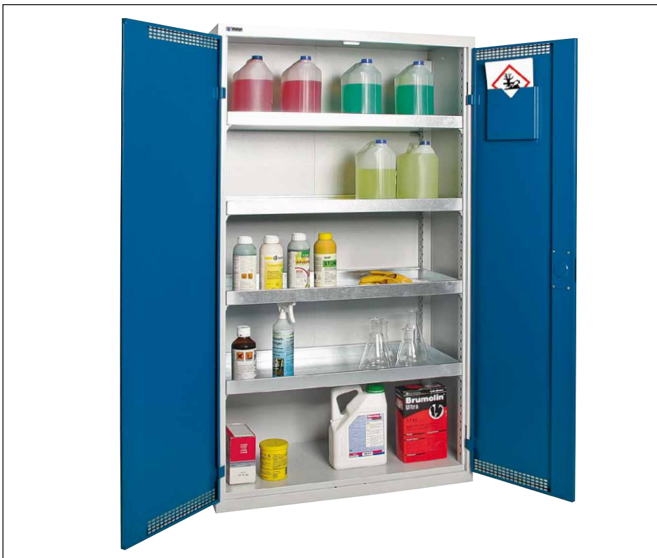
Typ SIW 2005