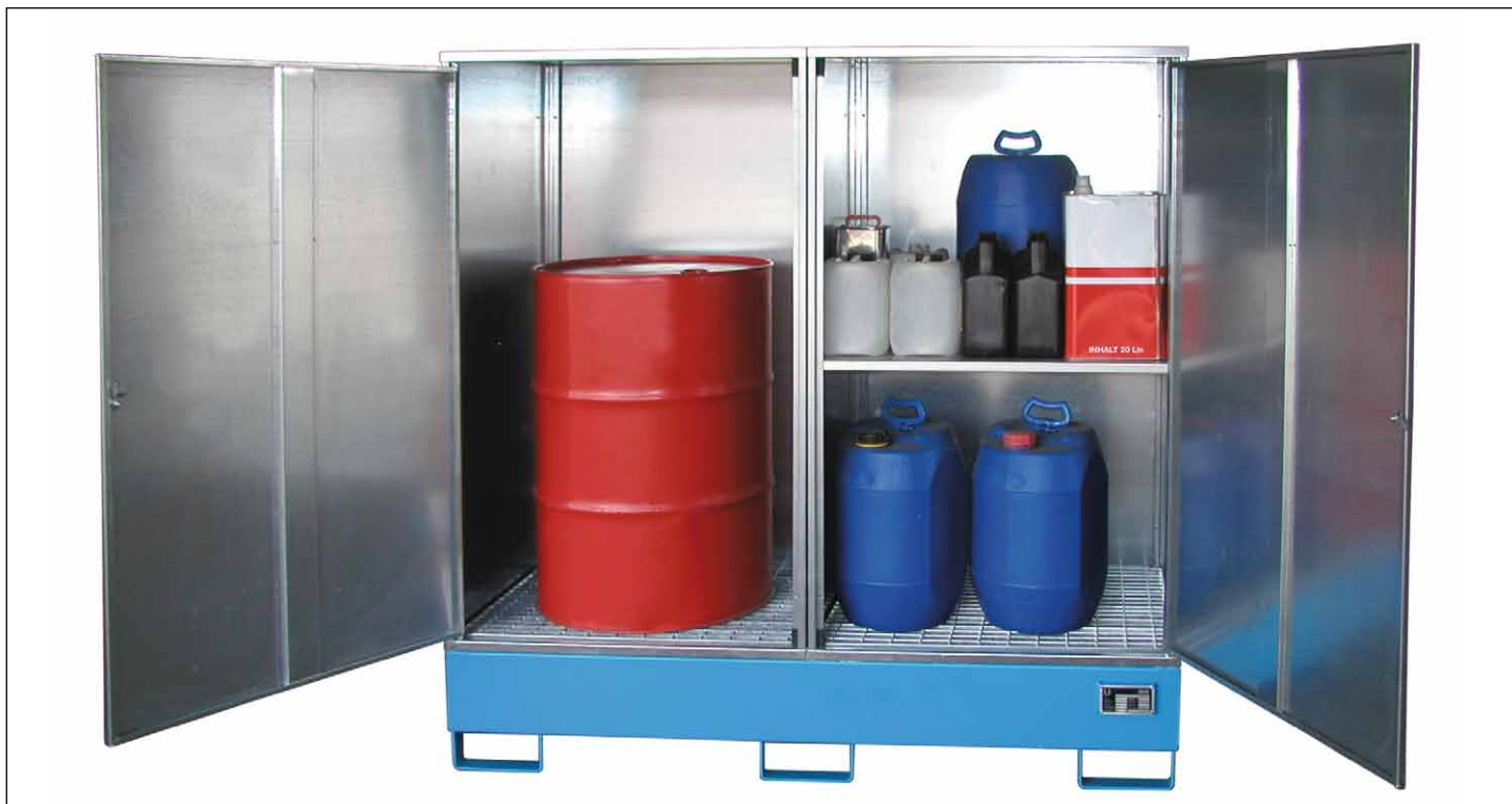
Typ GS-2 mit Zwischenboden (Zubehör)