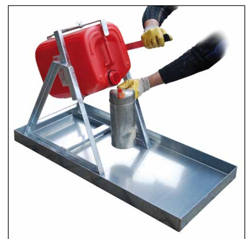
Typ KGW 2 mit Kanister-Abfüllhilfe Typ KAH-25 (siehe Seite 98) Zubehör