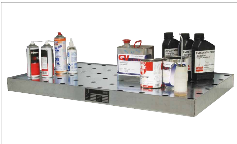
Typ KGW mit Lochblech-Rost (Zubehör)