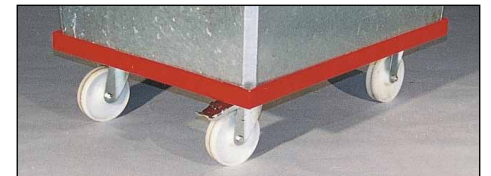
Typ MC mit Fahrgestell (Zubehör)