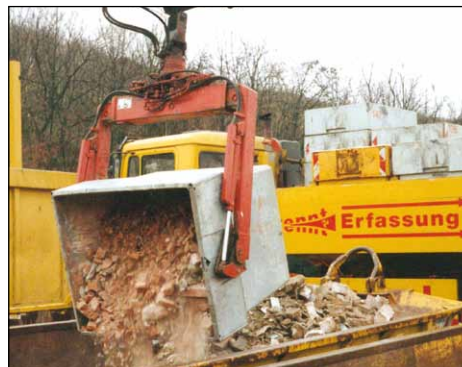
Typ MC 1000 mit Typ MCG (Zubehör)