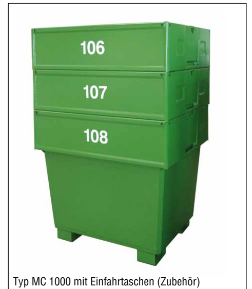
Typ MC 1000 mit Einfahrtaschen (Zubehör)