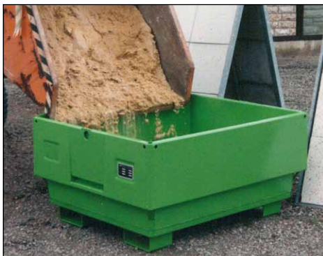
Typ MC 500 mit Einfahrtaschen (Zubehör)