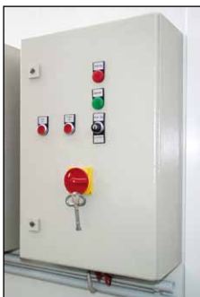
Schaltschrank mit Funktionstasten