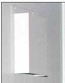
Zu-/Abluftöffnung mit Brandschutz