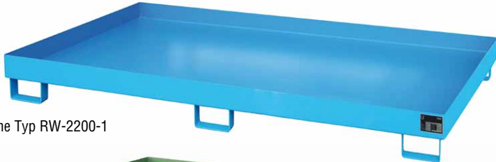
Regalwanne Typ RW-2200-1