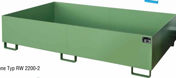
Regalwanne Typ RW 2200-2