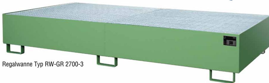
Regalwanne Typ RW-GR 2700-3

Mit Hilfe von Regalwannen können auch bestehende Regalsysteme wirtschaftlich und schnell gesetzeskonform umgerüstet werden