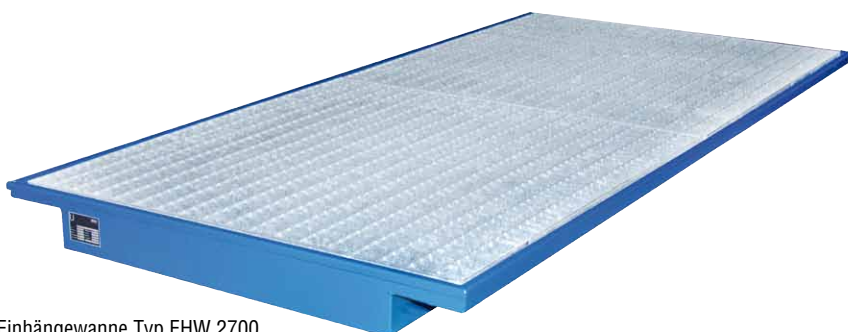
Einhängewanne Typ EHW 2700