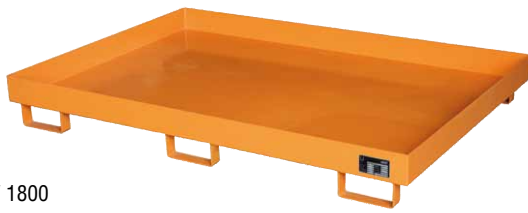
Regalwanne Typ RW 1800