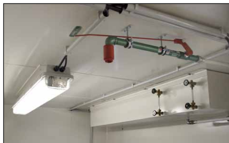
Notdusche mit 250-Liter-Tank und ex-Beleuchtung