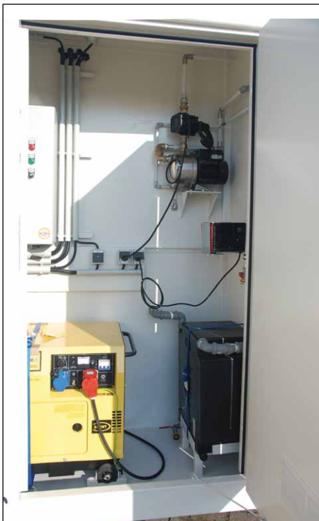
Technikraum mit Ventilator, Schaltschrank und Notstromaggregat