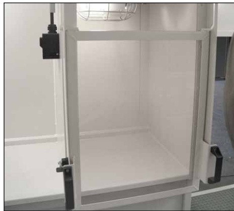
Labor-/Analyseschrank mit Absaugung, Beleuchtung