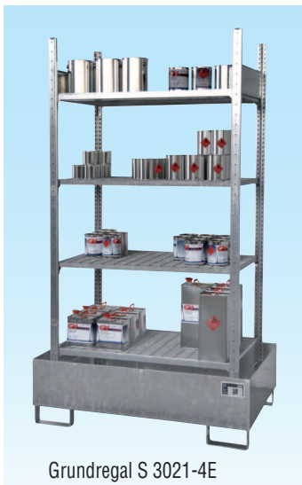
Grundregal S 3021-4E