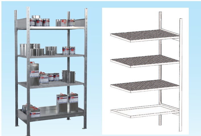
Grundregal S 3017-4E