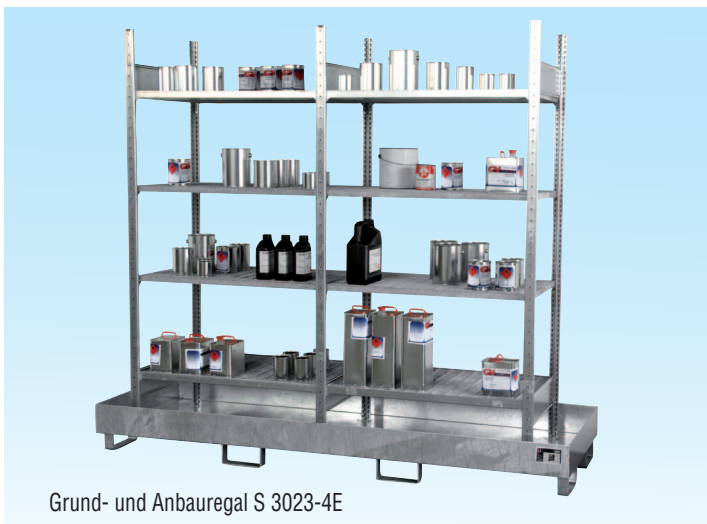
Grund- und Anbauregal S 3023-4E