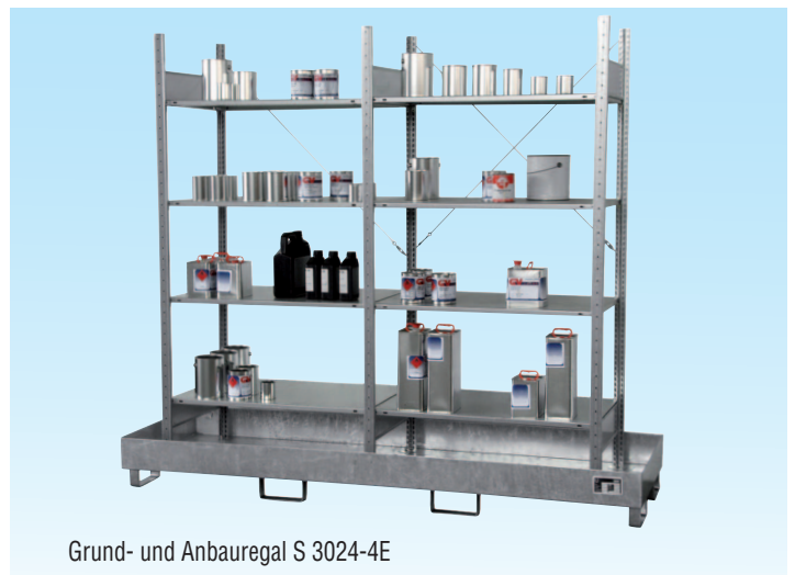
Grund- und Anbauregal S 3024-4E