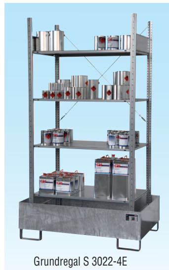
Grundregal S 3022-4E