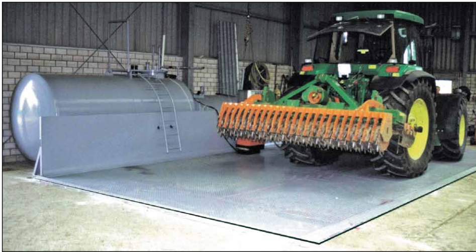
Typ TAW mit Anfahrtschutz (Zubehör)