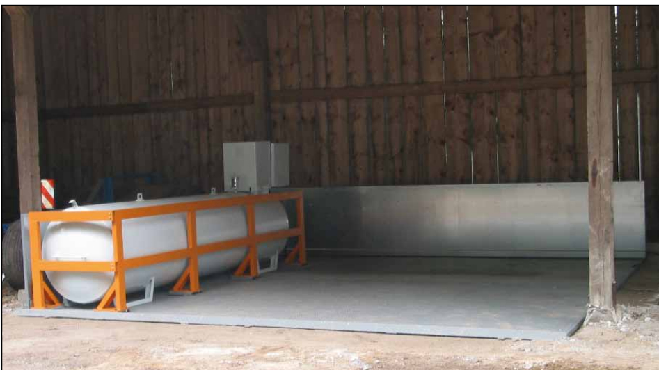
Typ TAW mit Anfahrtschutz (Zubehör)