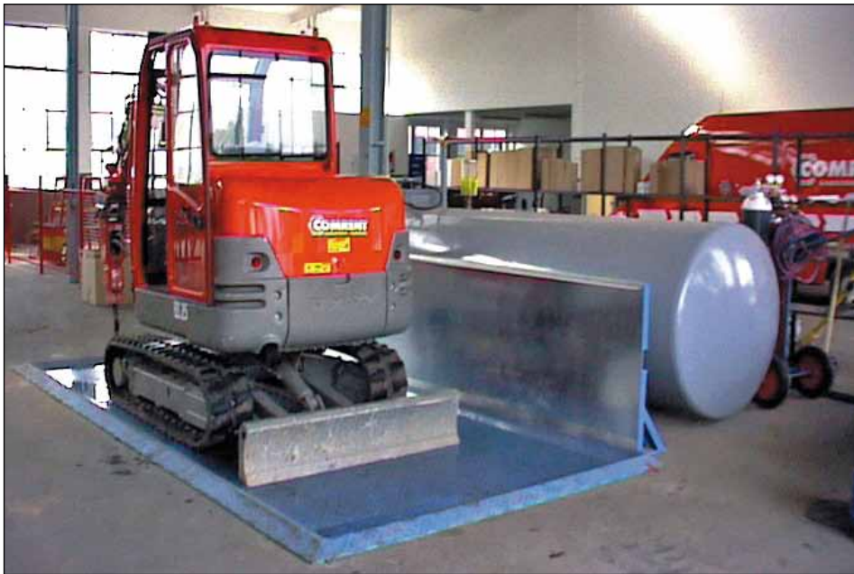
Typ TAW mit Anfahrtschutz (Zubehör)