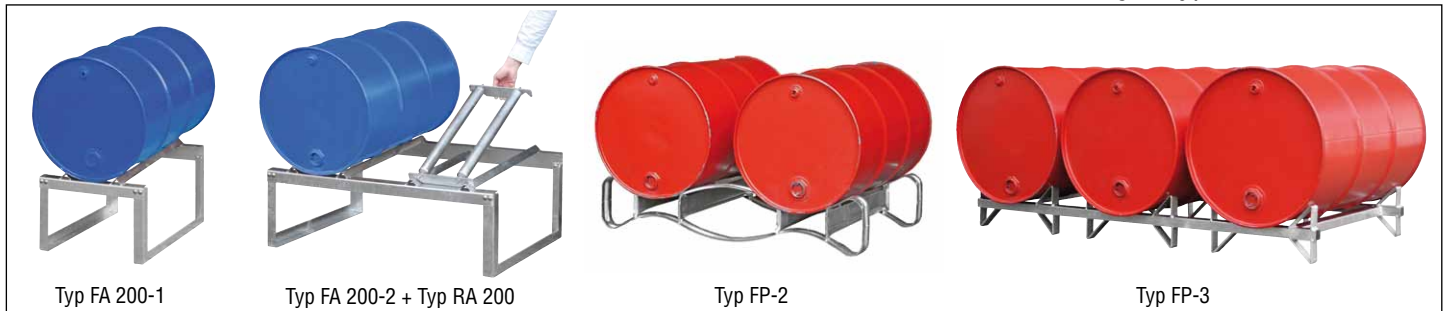
Typ FA 200-1