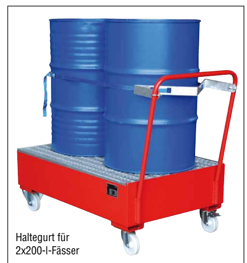
Haltegurt für 2x200-l-Fässer