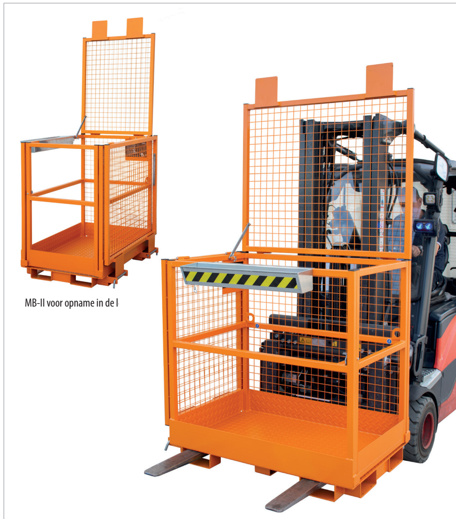
MB-II voor opname in de l