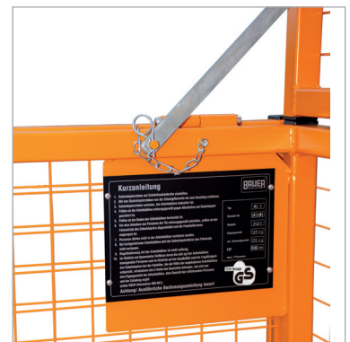
Beveiligingen van de neerklapbare beschermroosters Korte gebruiksaanwijzing