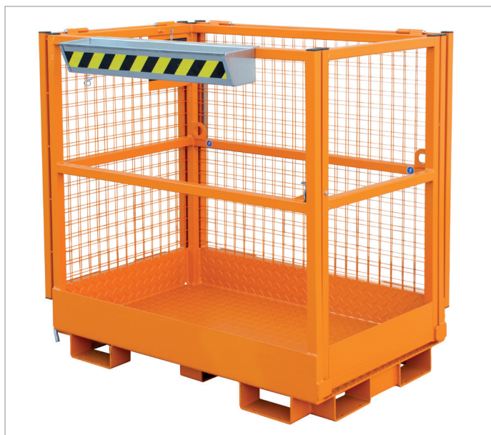
Ruimtebesparende opslag dankzij aan beide zijden neergeplapte beschermroosters