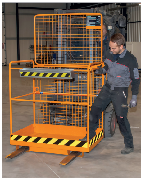
Ingang door heffen van veiligheid-stang