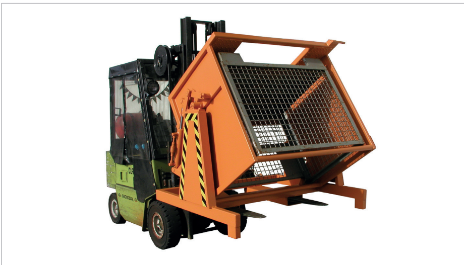
KGM à frein de basculement réglable