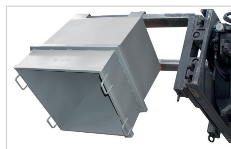
UC-lediging met heftruck-draaikraan