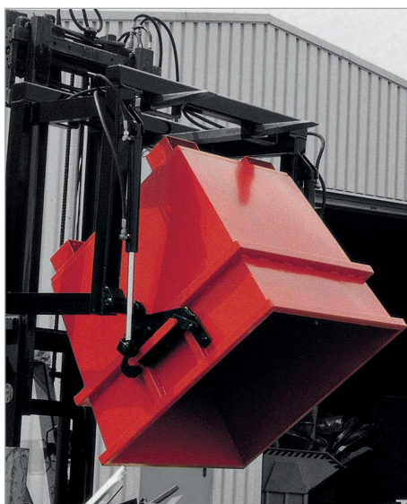
UC met opname voor kieptraverse en kieptraverse UCT