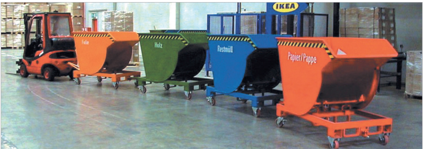
BKM met wielen, aanhangerinrichting met dissel