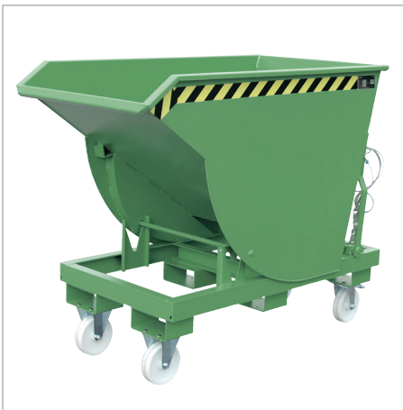
BKM met wielen