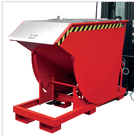
BKM met deksel