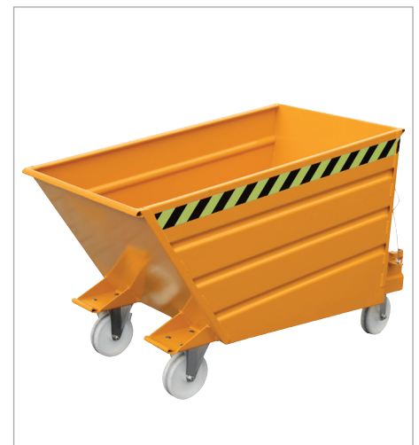
VD met wielen