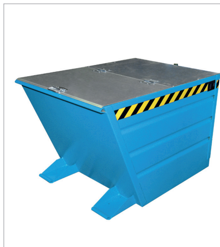
VG met deksel