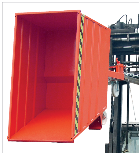
VG met wielen