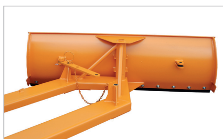
SCH-G naar links ingesteld