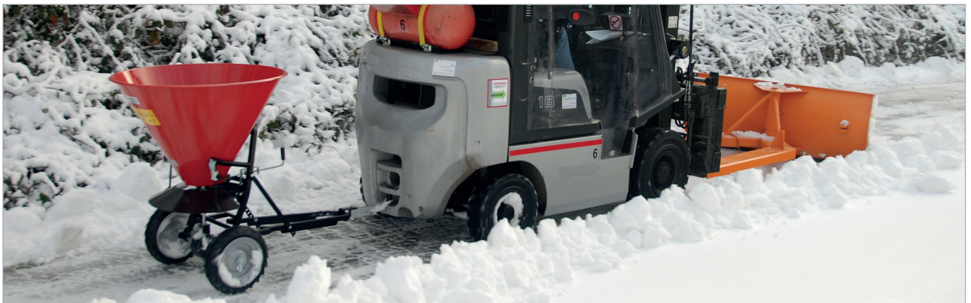
Schneeschieber SCH-G (siehe Seite 56) in Kombination mit STW 100