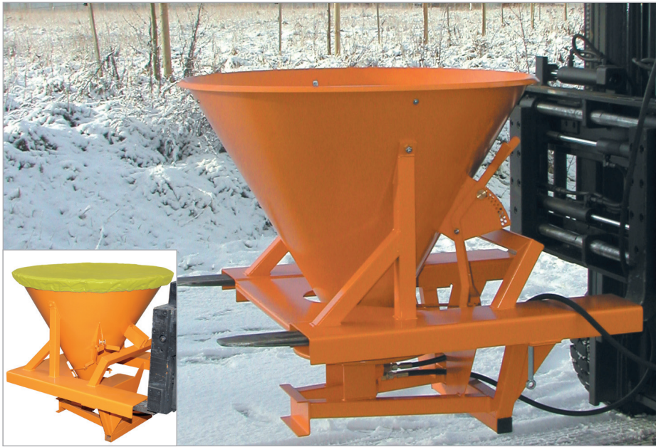
SH mit Abdeckplane