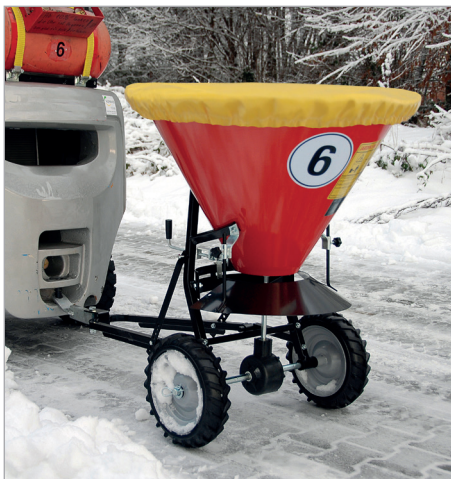
STW 100 mit Abdeckplane