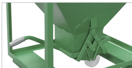
Fermeture spéciale par leviers croisés (SR, SG, SRE)