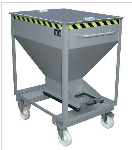
SRE-D avec couvercle