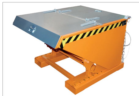
EXPO-E met deksel