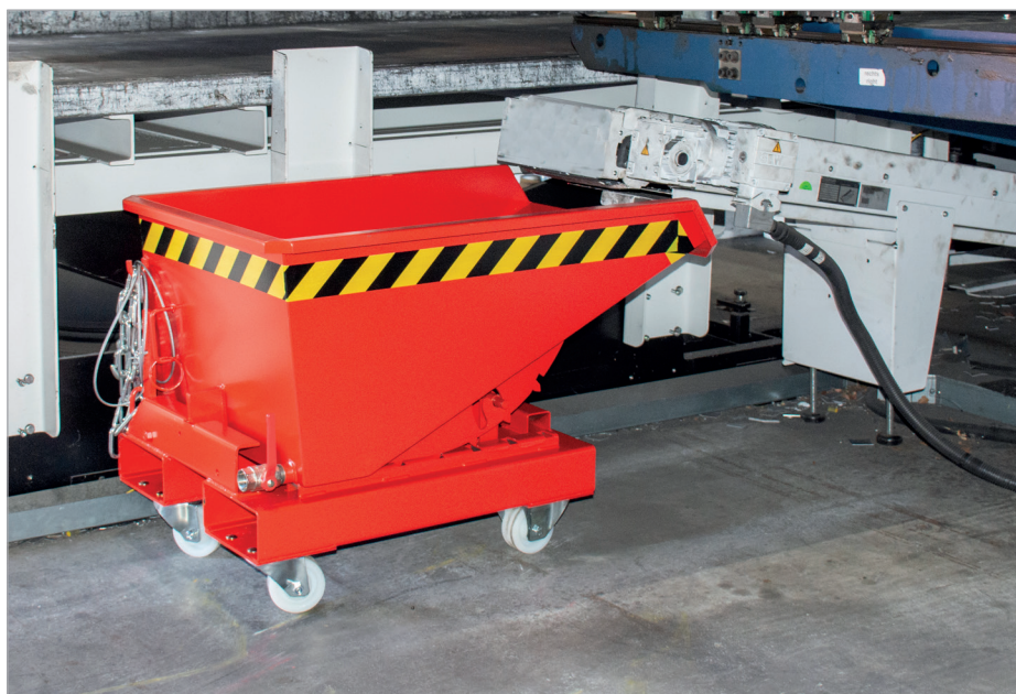
EXPO-E met wielen