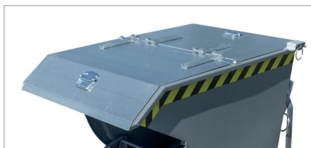
SKM met deksel