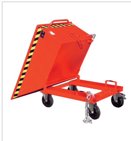
SKN met wielen (massief rubber)