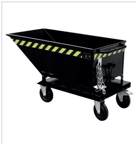
KN met wielen (massief rubber)