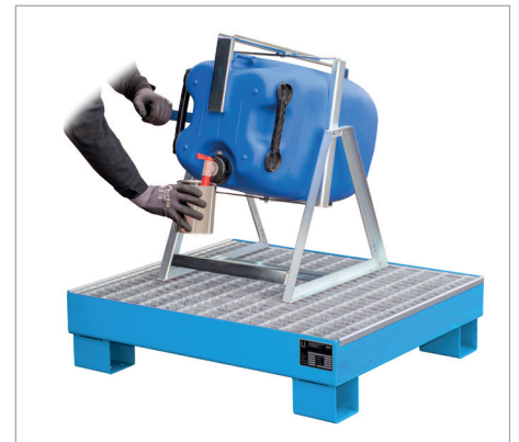
AW 60-2/M mit Kanister-Abfüllhilfe KAH-60 (siehe Seite 116)