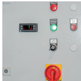
Armoire électrique avec touches de commande