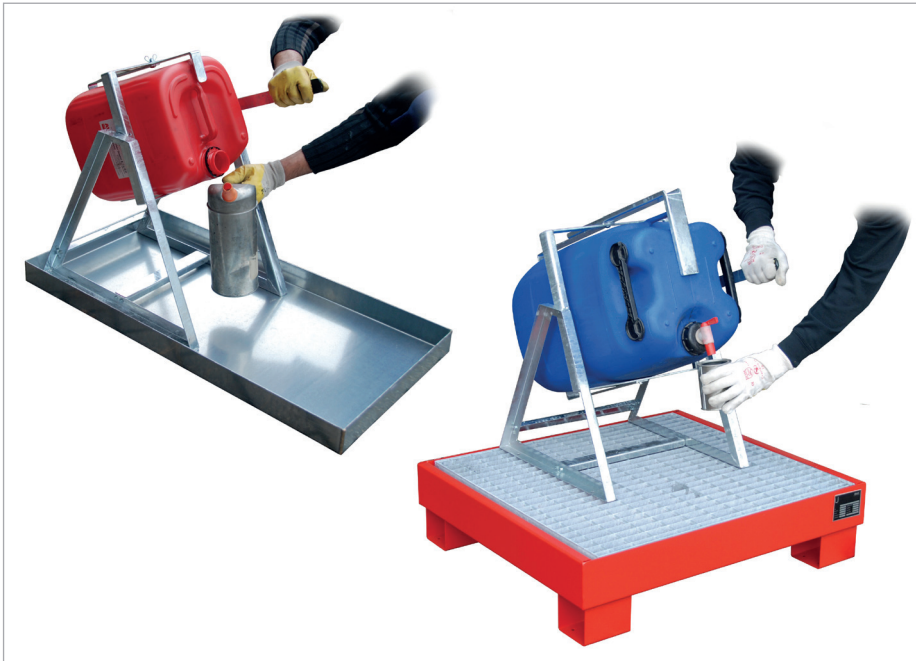
KAH-25 mit Kleingebindewanne KGW-2