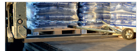
Heranziehen der Palette mittels Gabelstapler in die „Erste Reihe“