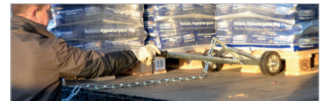
Einsetzen in die Palette