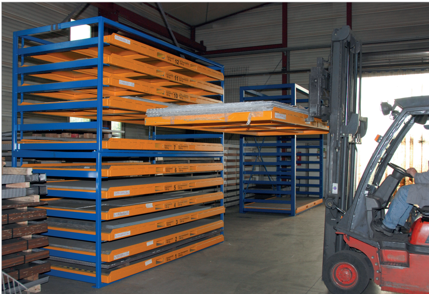
KBR 3 - superposé 2 fois