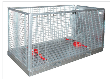
MTP mit Zurr Gurten (Zubehör)