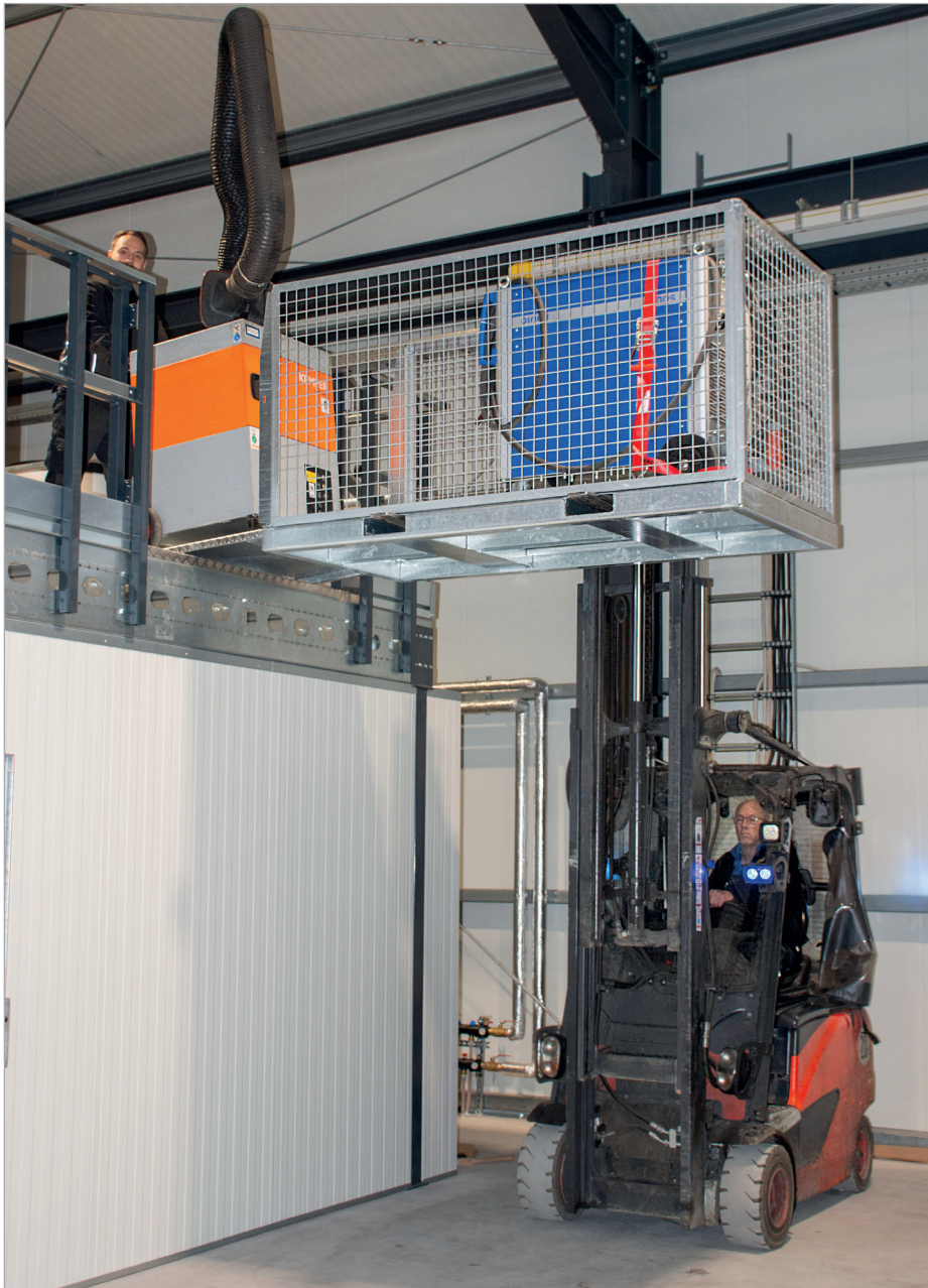
MTP mit Zurr Gurten (Zubehör)

Zum sicheren Lagern, Verladen und Transportieren von Gütern, z. B. Transportgeräte