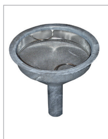
Entonnoir avec tamis en inox