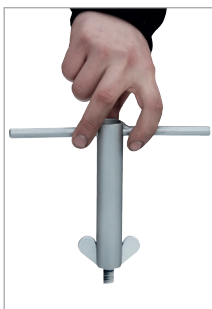
Clé pour écrous papillon