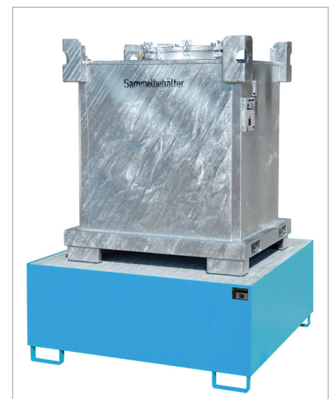
SAF avec bac de rétention de type AW 1000 (voir page 106)