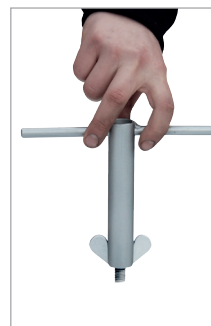
Sleutel voor vleugelmoeren (optie)