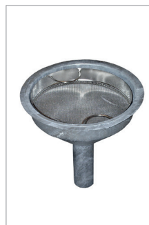
Trechter met zeef van roestvrij staal (optie)