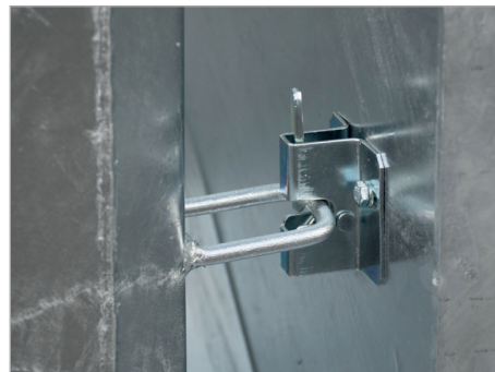
Arrêteur de couvercle automatique