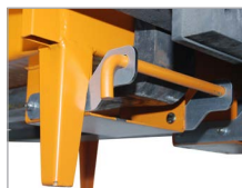
Bolzensicherung am Gabelstapler