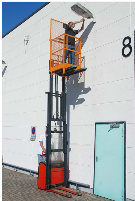
MB-I am Deichselstapler