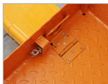
Sicherung am Deichselstapler