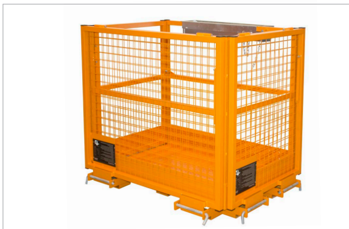
Platzsparende Lagerung durch beidseitig zurückgeklappte Schutzgitter