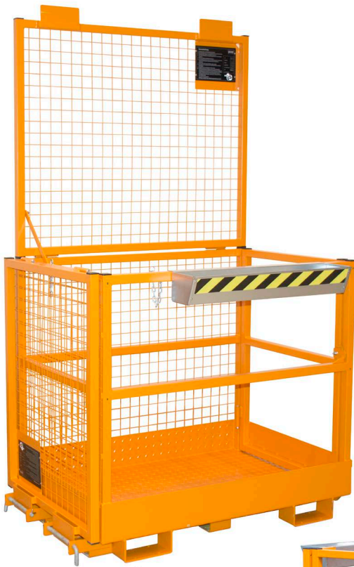
MB-II zur Queraufnahme