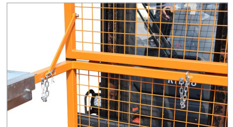
Sicherungen der abklappbaren Schutzgitter