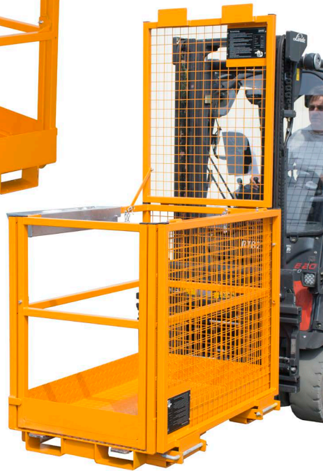
MB-II zur Längsaufnahme

Beidseitige Aufnahme mit Gabelstapler, an der breiten und der schmalen Seite, Einfahrtaschen an den nicht verwendeten Einfahrtaschen.