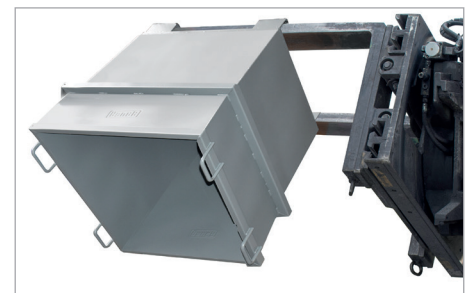
Vidange par palonnier