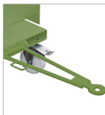
Anhängervorrichtung mit Deichsel