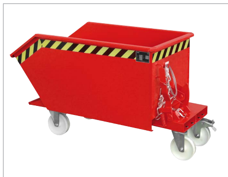
GU mit Rollen