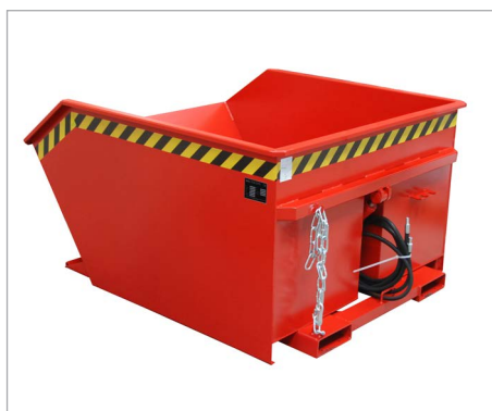
GU mit hydraulischer Kippvorrichtung