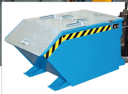
GU mit Deckel