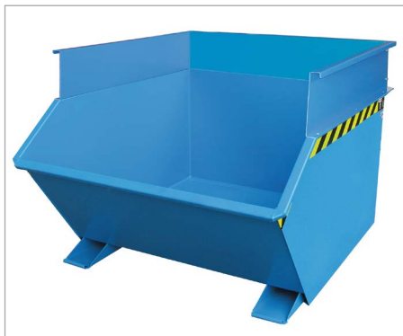
GU mit Aufsatzrahmen